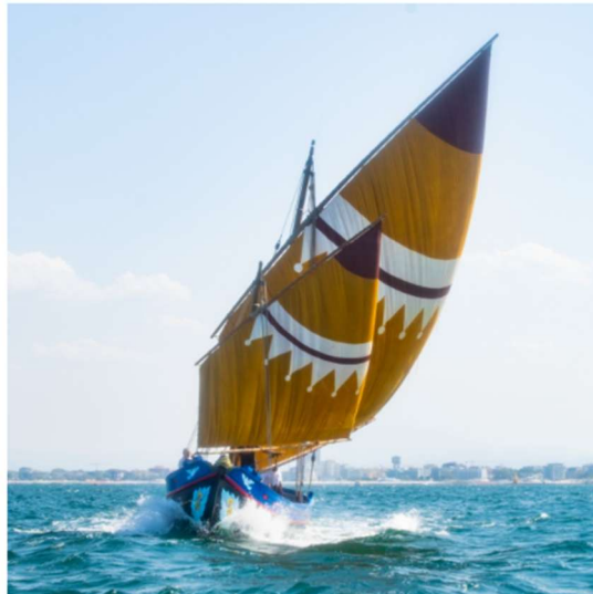
[ Il bragozzo San Nicolò in navigazione ]

La vela al terzo è un tipo di vela latina evoluta, diffusa lungo le coste dell'alto Adriatico dal XVIII secolo fino alla metà del XX secolo, usata su imbarcazioni da pesca e piccolo trasporto come bragozzi, trabaccoli, lance e battane. Deve il suo nome al fatto che il pennone superiore è fissato all'albero ad un terzo della sua lunghezza. La forma nasce dall'incontro della vela latina mediterranea con le tradizioni delle acque interne della pianura padana, e si è sviluppata esclusivamente sulle barche dell'Adriatico settentrionale, comprese la Romagna, l'Istria e il golfo del Quarnaro. Le vele sono di forma trapezoidale e spesso tinteggiate con colori vivaci, personalizzate con decorazioni riferite alla famiglia proprietaria della barca, una sorta di vera e propria “araldica popolare”.